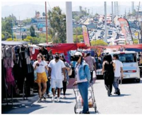
En sobremuebles solo se venderán alimentos, perecederos y artículos de limpieza. RAMÓN HURTADO

ACTIVOS EN BAJA CALIFORNIA hay 550 casos activos de Covid-19, de ellos, 166 corresponden a Mexicali, 115 a Tijuana y 43 al puerto de Ensenada