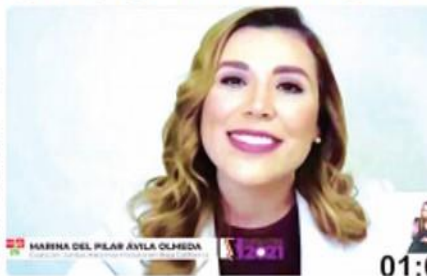
MARINA DEL PILAR ÁVILA OLMEDA

Propuso consolidar políticas económicas federales en el estado, así como reforzarlas mediante mecanismos innovadores